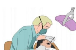
4-d en -tist