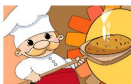
2-b ak -er