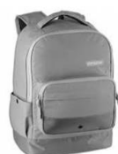
3-b ac kpack