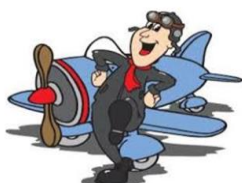
1-p il -t

به تصاویر نگاه کنید و املای کلمات داده شده را کامل نمایید.