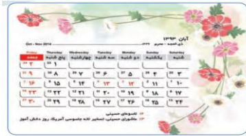
w - -kd - ys