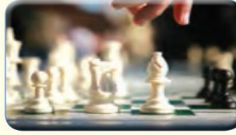
ch - s -