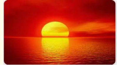
s - n - et