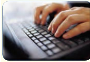
t - p -