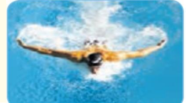
s - i -