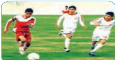
f - otb - ll

املاى صحيح را با توجه به تصاوير بنويسيد .